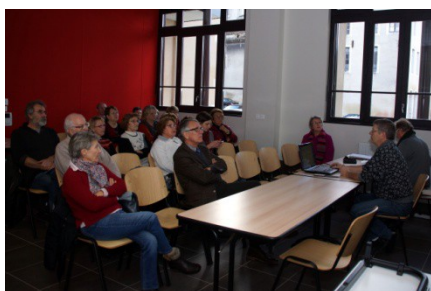
Vue de l'assemblée

L'assemblée générale extraordinaire se tenait dans la foulée pour une modification des statuts. La modification portait sur la domiciliation à la Maison des Associations. Les objectifs du club n'ont pas été modifiés. Même si nous utilisons 50% d'ordinateurs sous Windows, la vocation du club reste l'utilisation maximum de logiciels libres.