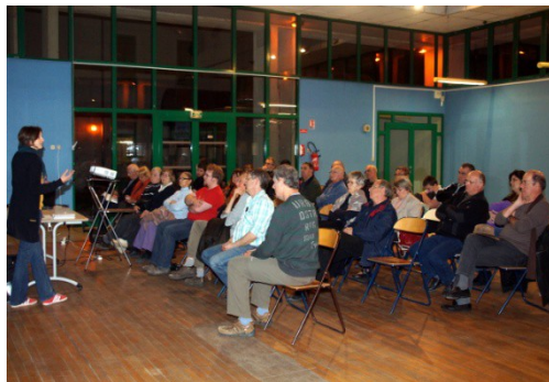
Les participants à la conférence

La formation Linux a lieu les 2 ème et 4 ème samedis de chaque mois.