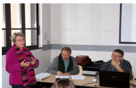
La trésorière présente les comptes